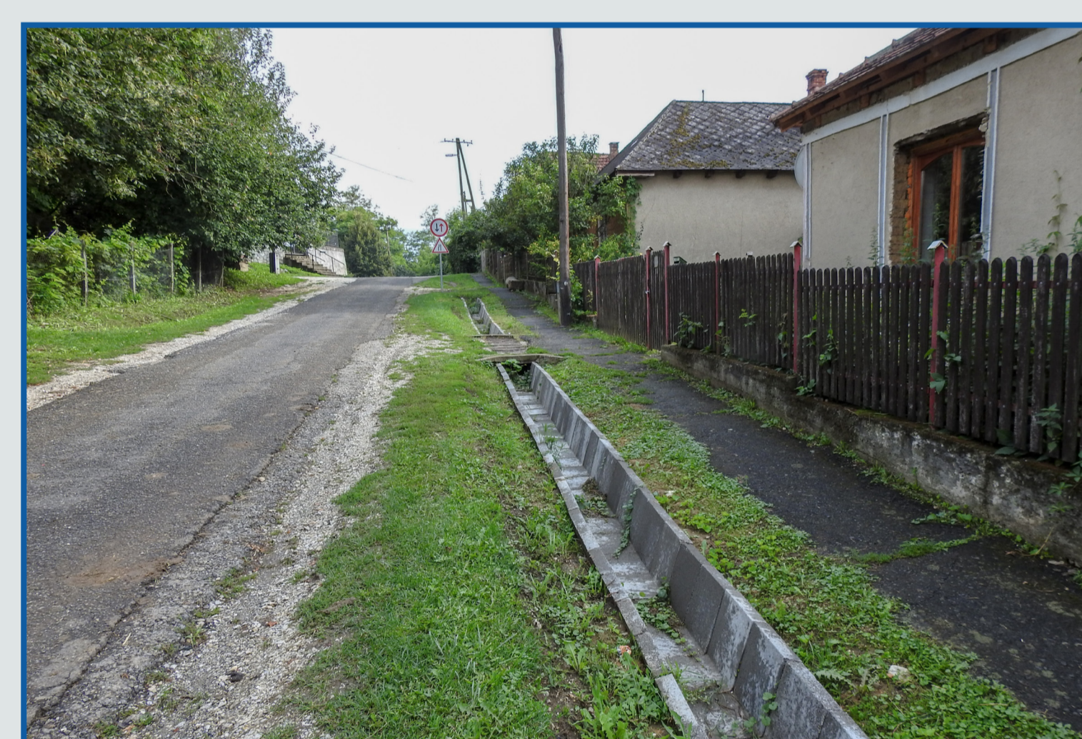
Belvíz elvezető árok építés Petőfi utcán