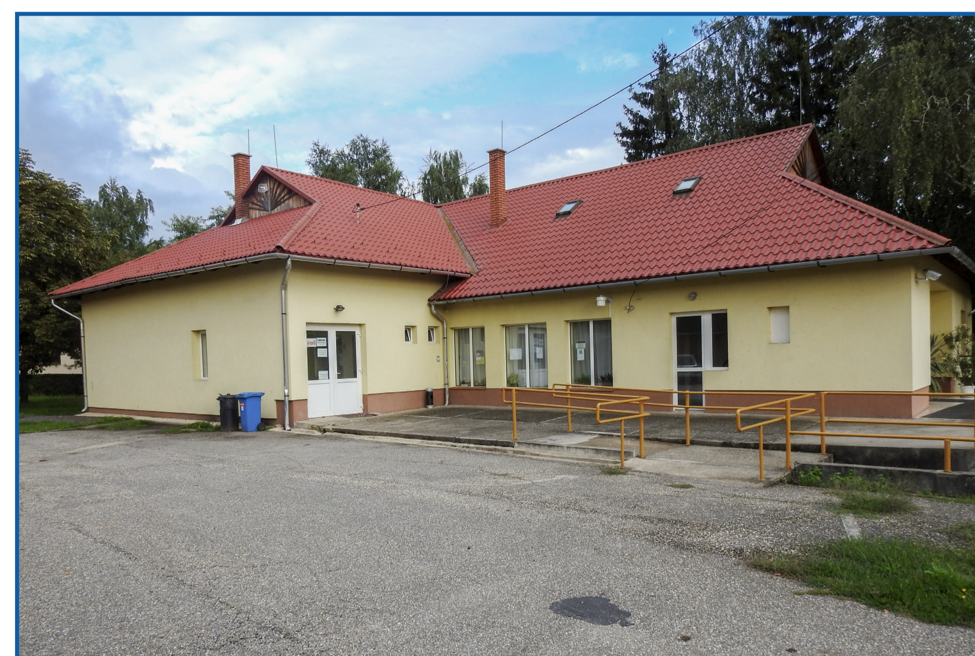
Művelődési ház külső szigetelése