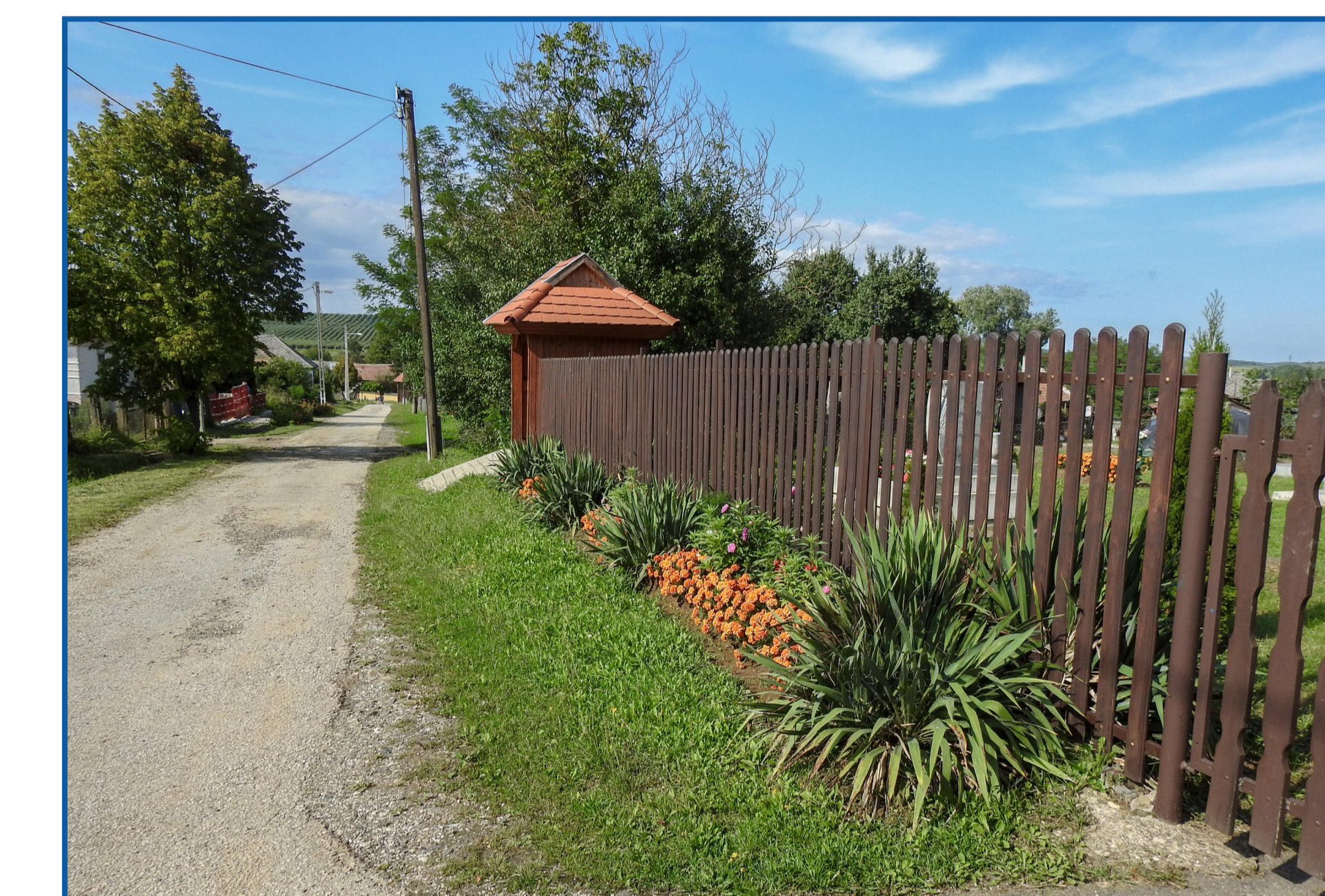
Hulladék tároló építése temetőn