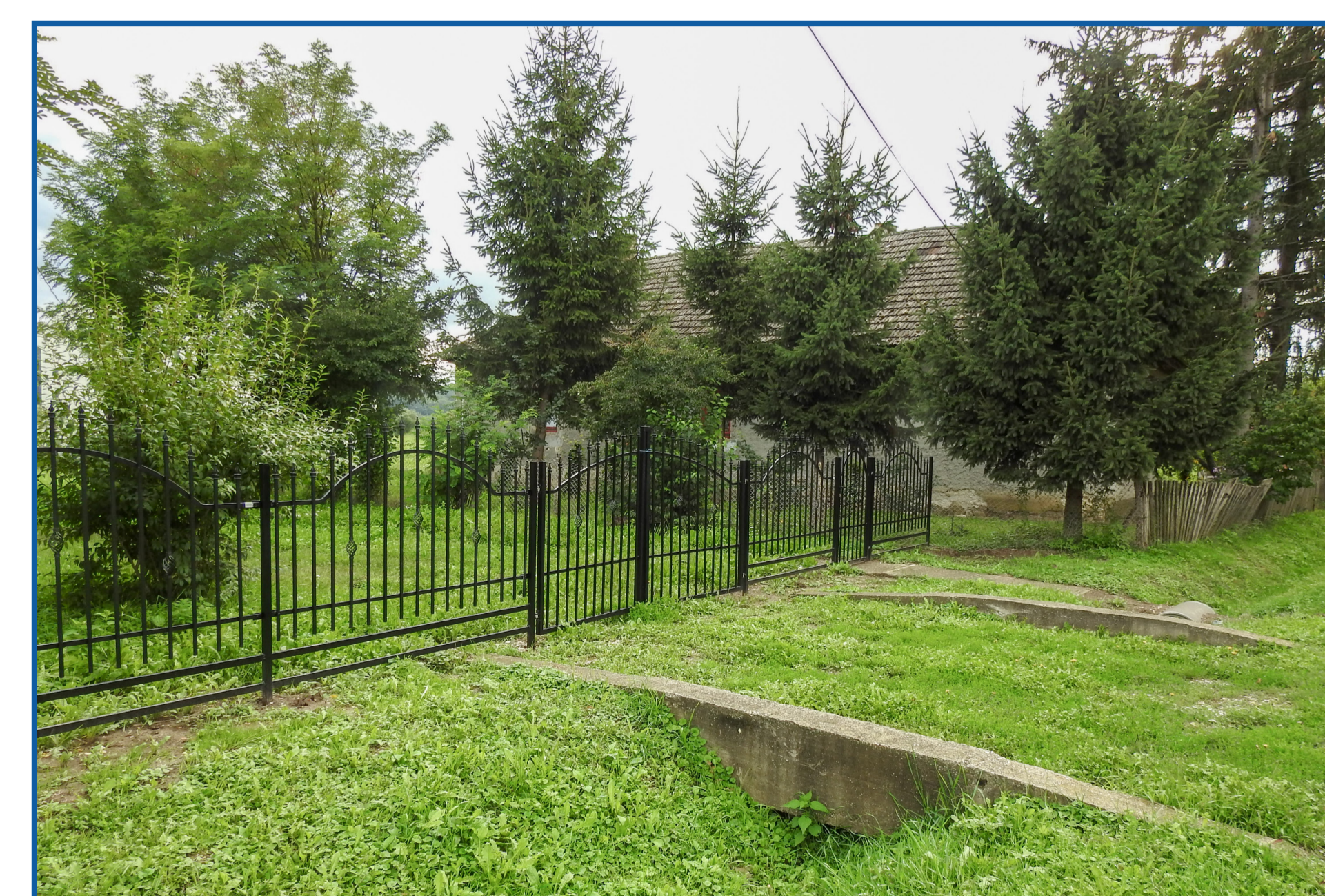
Kerítés építés - Református templom