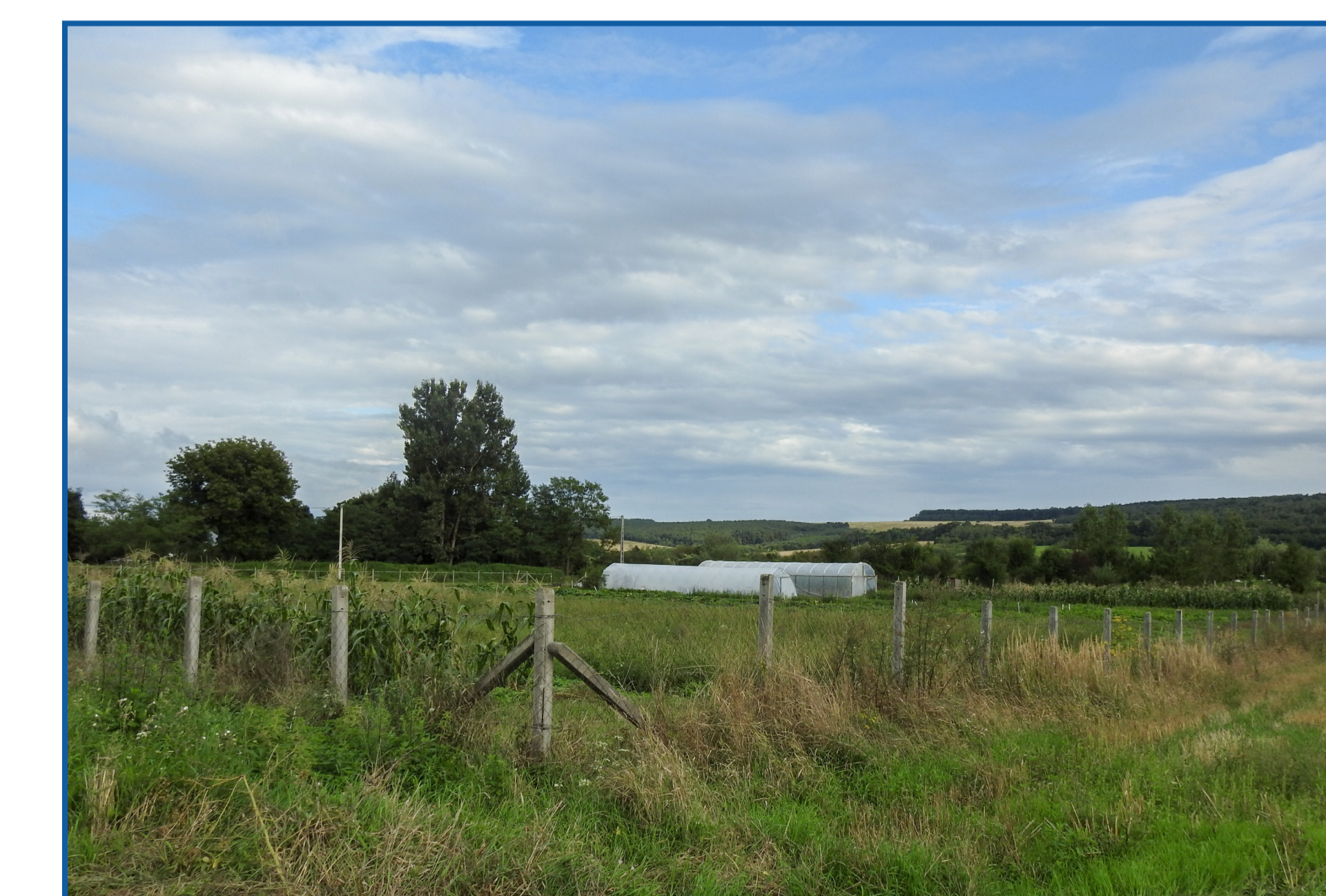
Mezőgazdasági program növénytermesztés