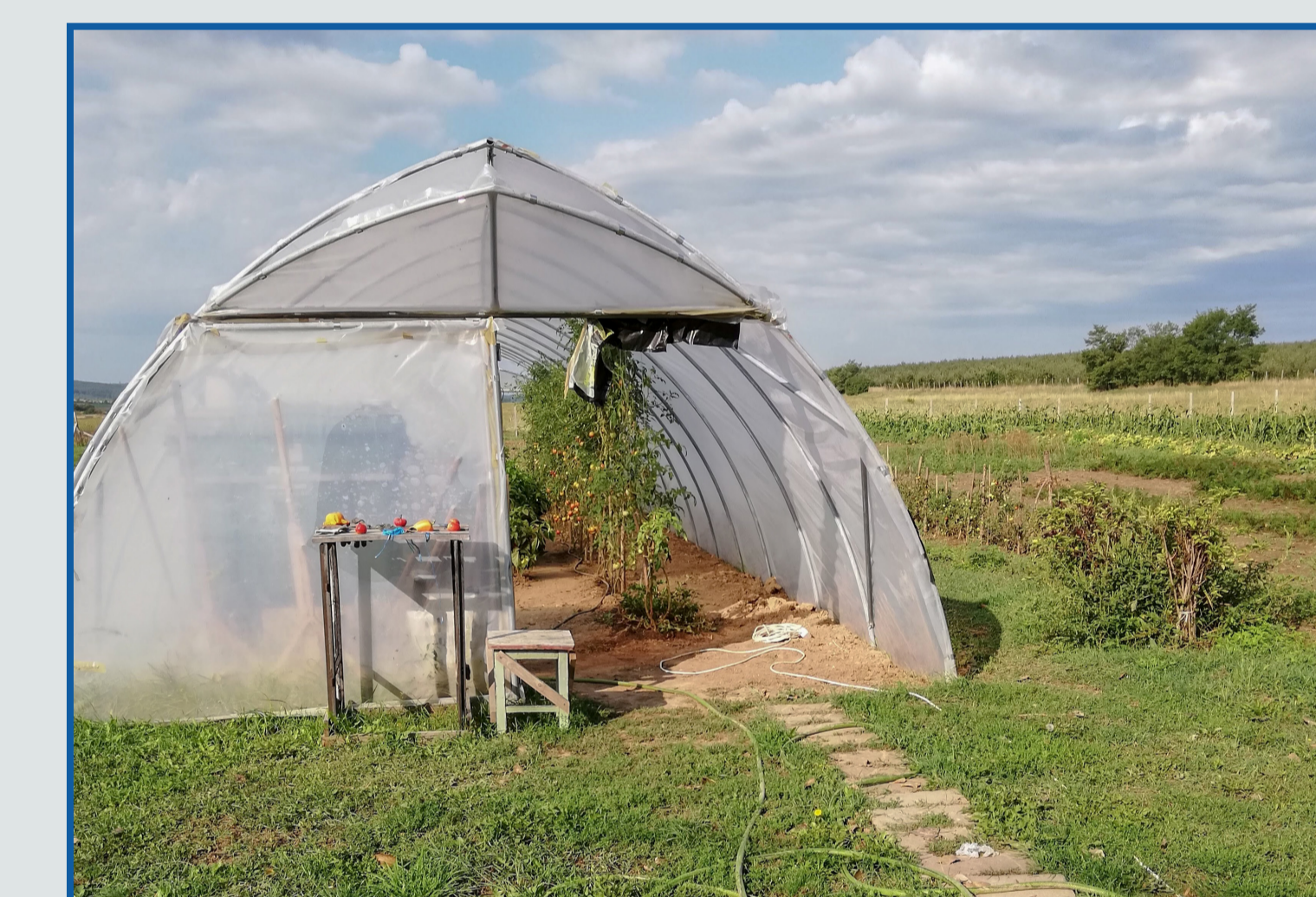
Mezőgazdasági program - növénytermesztés