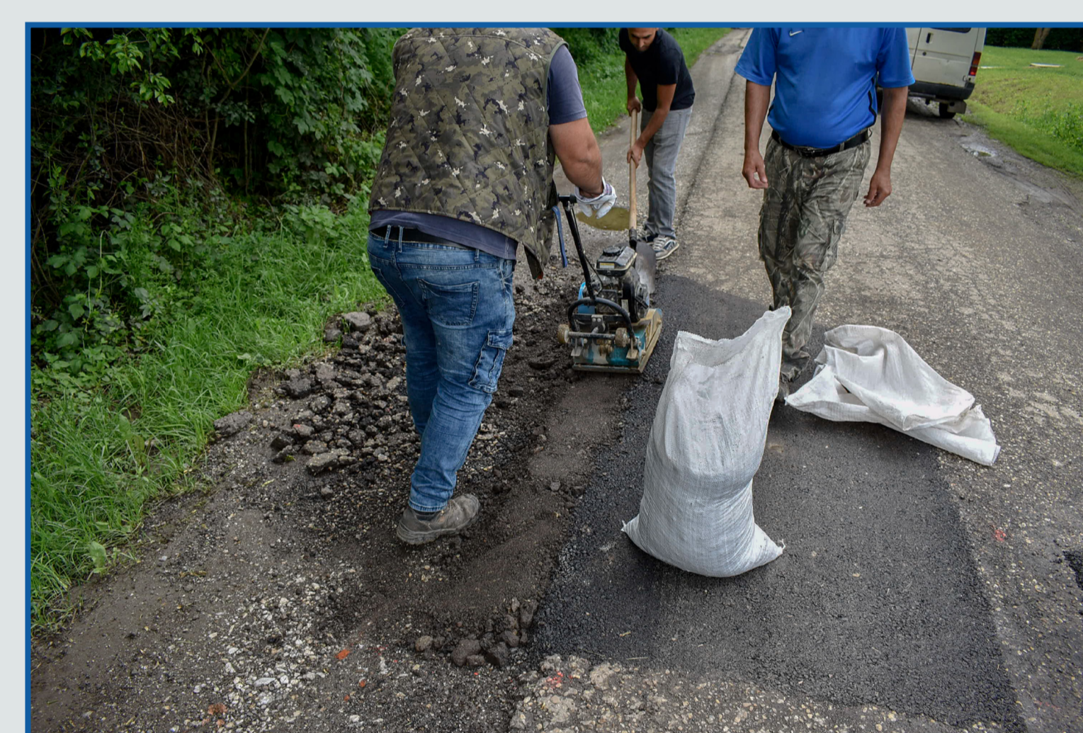
Belterületi utak karbantartása, kátyúzása