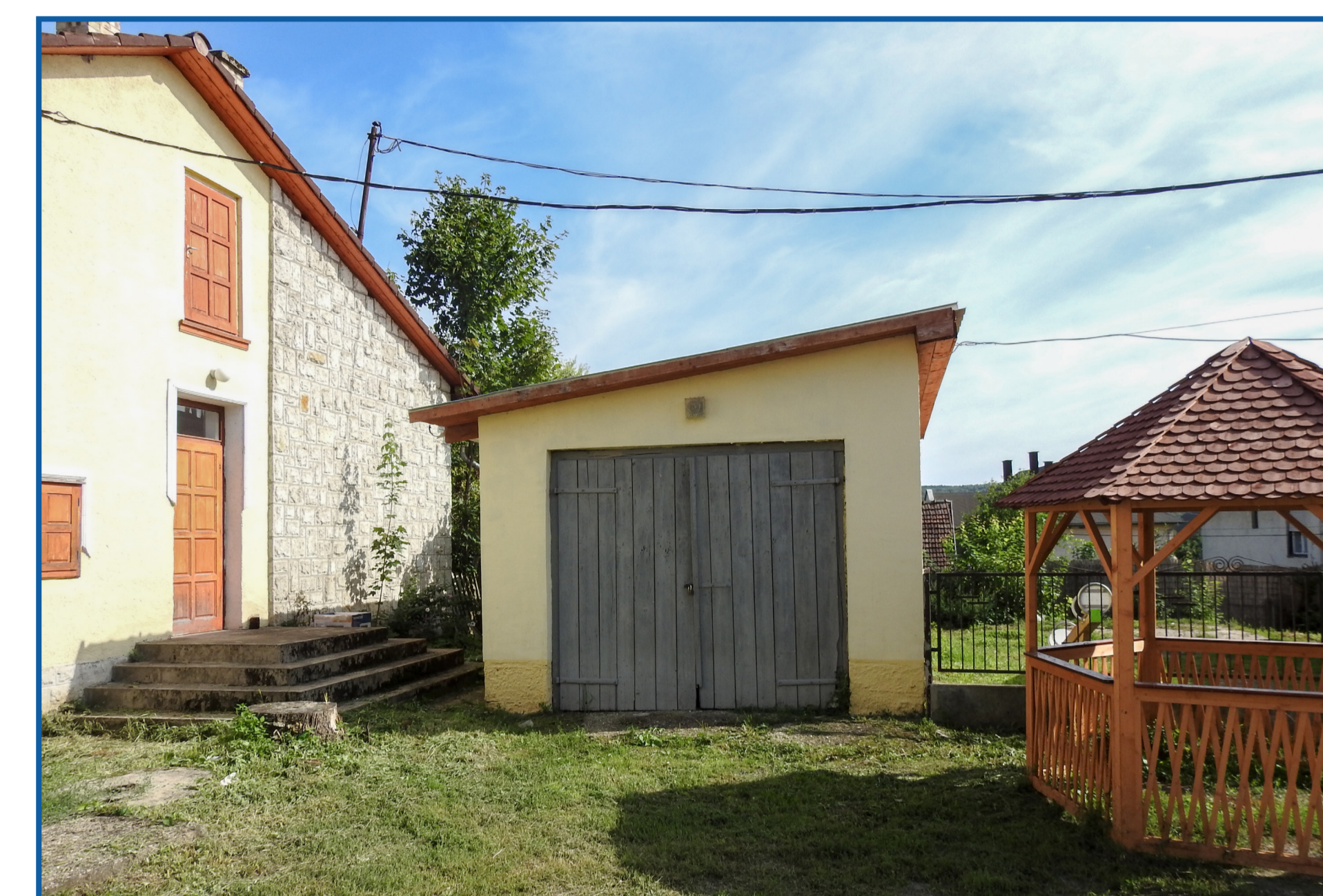
Garázs felújítás, tetőcsere