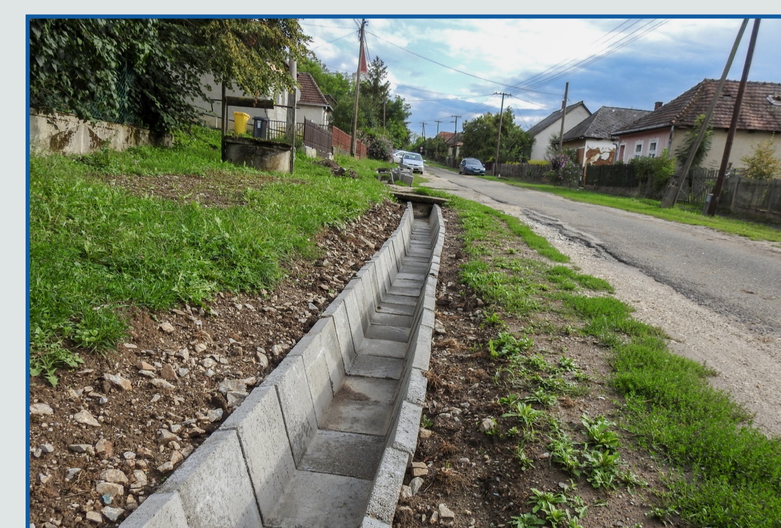
Belvíz elvezető árok építés Petőfi utcán