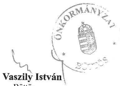
Vaszily István Büttös polgármestere