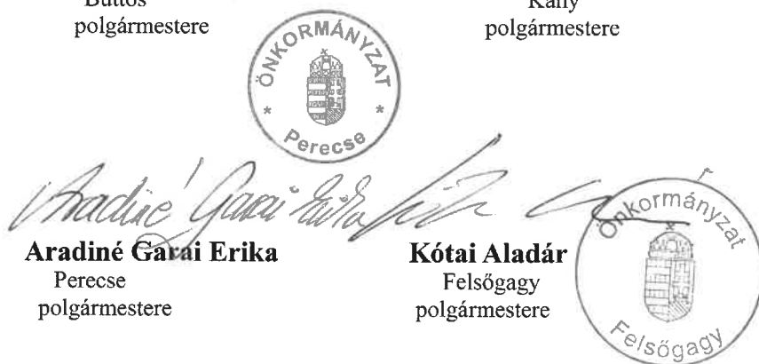
Aradiné Garai Erika Percse polgármestere